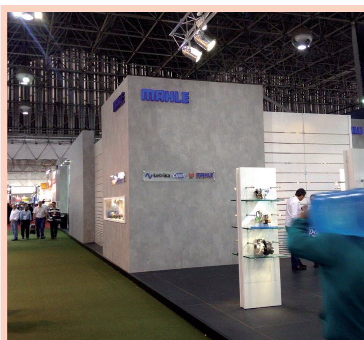
A Mahle também foi uma das associadas da ACIL que participou da feira

A expectativa dos organizadores era receber 70 mil visitantes nos 78 mil m².