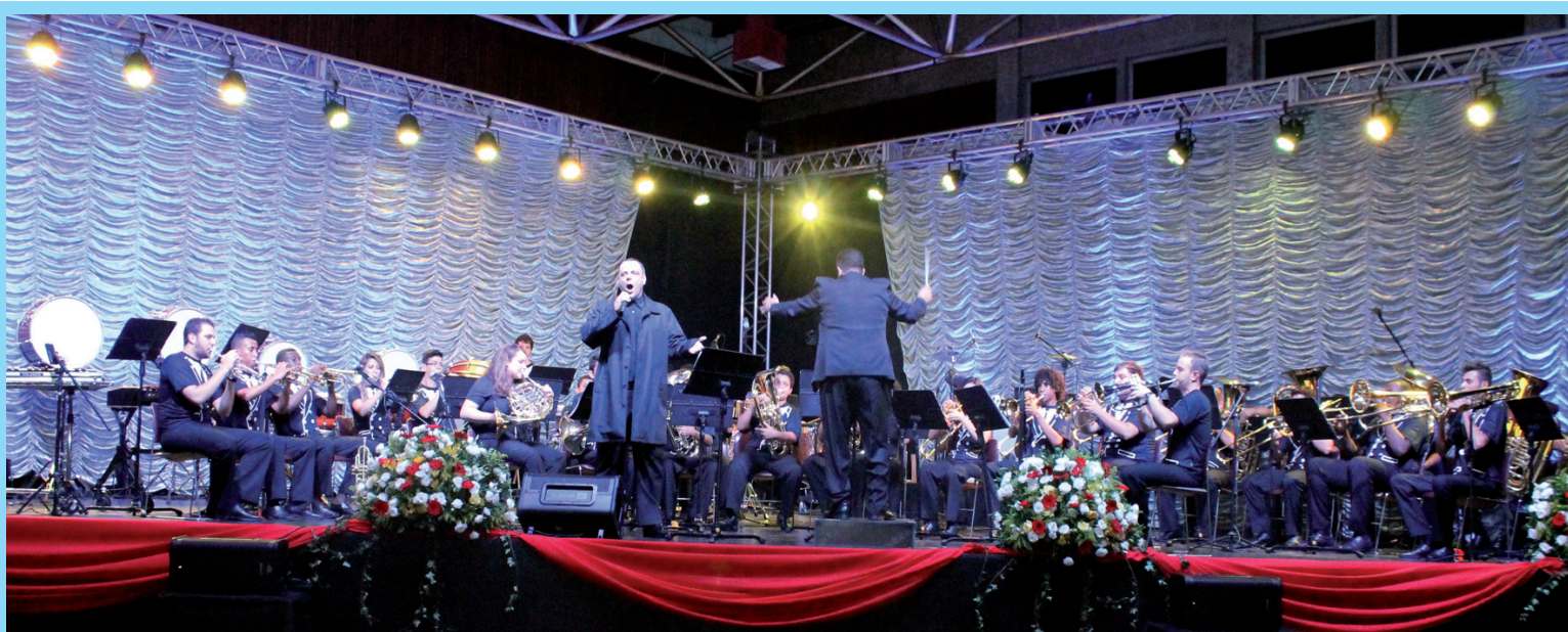
Os Concertos de Natal são realizados há 10 anos pela Banda Marcial do Senai. Desde 2012, o incentivo é totalmente direcionado para a ALICC