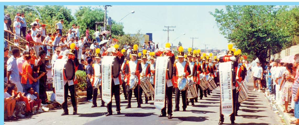
Fanfarra da Escola Senai “Luiz Varga” em 1997

Esse reconhecimento só abriu as portas para inúmeras conquistas, que ao lado do regente, da coreógrafa e de toda a equipe de apoio, os integrantes puderam comemorar. Um concurso realizado em São Paulo trouxe uma surpresa e tanto, o título de Banda Modelo pela Associação das Bandas Marciais, “comecei a ter ainda mais a obrigação de