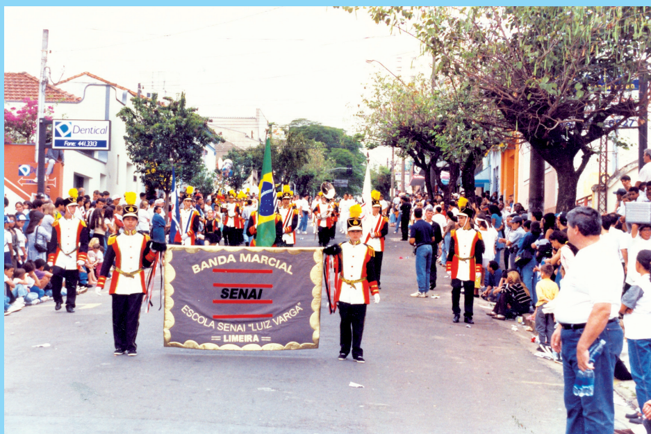
Banda Marcial da Escola Senai "Luiz Varga" em 1998