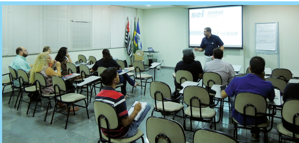
As palestras ministradas de segunda a quinta-feira na ACIL trouxeram temas específicos para a categoria