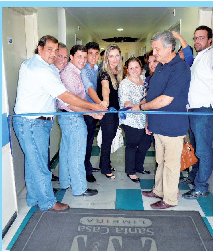
Inauguração contou com a participação dos doadores