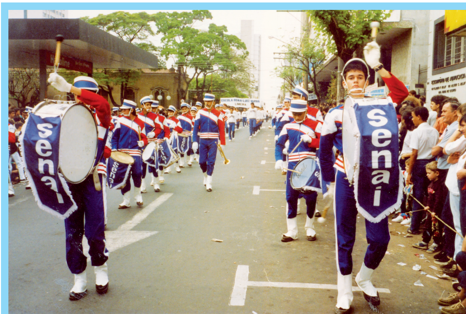
Desfile da Fanfarra na Rua Dr. Trajano de Barros Camargo em 1990